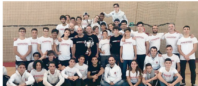
LA SQUADRA DELLA DAI KI DOJO CATANIA CHE HA VINTO I REGIONALI DI JU JITSU